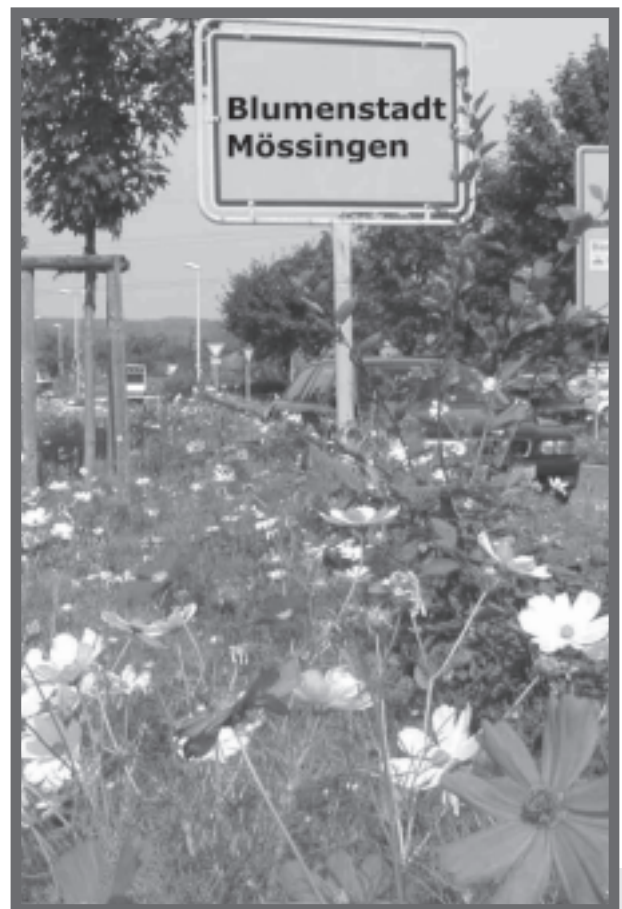
Bild 1: Aus rechtlichen Gründen auf den Schildern nur Fotomontage - in der Praxis aber längst Wirklichkeit: Die Blumenstadt Mössingen im Blickpunkt.

Kein Wunder, dass die Blumenstadt Mössingen zumindest in Fachkreisen (aber nicht nur) mittlerweile ein Begriff ist. Regelmäßig erreichen die Stadtgärtnerei Anfragen aus der ganzen Republik. Denn so leicht nachzumachen, wie es aussieht, ist das Mössinger "Blumenfest" dann doch nicht. "Wir haben über die Jahre viel probiert und dabei gelernt", resümiert