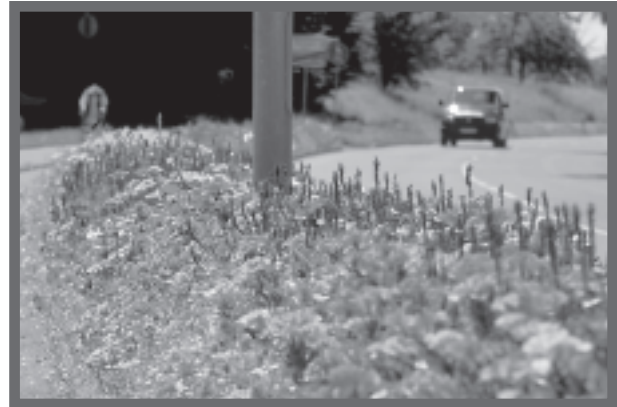
Bild 2: Blühende Straßenränder aus Sommerblumen und Stauden statt monotonem Rasen prägen das Bild der Blumenstadt Mössingen.

Schnell stellt sich bei diesen Blumenmischungen ein ökologisches Gleichgewicht ein. Das hört und sieht, wer sich den Mikrokosmos "Mössinger Blumenwiese" einmal aus der Nähe anschaut. Tatsächlich wuselt, summt und brummt es überall. Bienen sammeln Nektar, Schmetterlinge taumeln duftberauscht von Blüte zu Blüte. Käfer krabbeln, Vögel suchen Nahrung. Und nebenan läuft der Straßenverkehr.